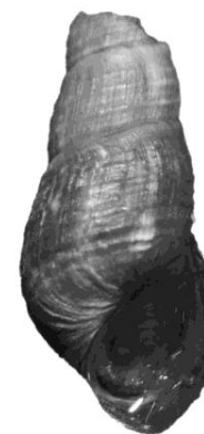
Figura 2. Melanoides tuberculata (Müller, 1774) del río Uruguay. Longitud total: 5,50 mm (LZ N° 103493).

En este contexto, el potencial establecimiento de la especie en el río Uruguay y sus áreas de influencia, sumado a la posible dispersión pasiva a